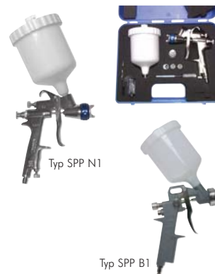
Typ SPP N1